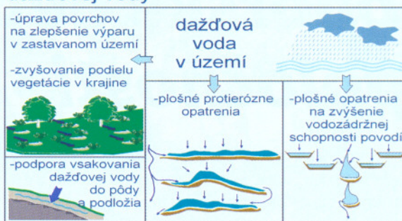
Obr. 3: Opatrenia na zabezpečenie plnenia základných funkcií krajiny pri distribúcii dažďovej vody. Grafické spracovanie schémy: Ing. arch. Ľubica Mokrišová.

V návrhovej časti stratégia odporúča konkrétne opatrenia, nástroje, úlohy, vecný a časový plán aktivít na jej implementáciu do praxe. K hlavným nástrojom riešenia patria: