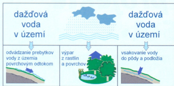
Obr. 2: Základné funkcie krajiny z hľadiska distribúcie dažďovej vody. Grafické spracovanie schémy: Ing. arch. Ľubica Mokrišová.

rany dažďových a povrchových vôd v území (tab. 2) a to prostredníctvom dôslednej plošnej realizácie protieróznych opatrení v území a plošnej realizácie opatrení na zvýšenie vodozadržnej schopnosti jednotlivých povodí (obr. 3). Tieto opatrenia sú z hľadiska realizácie rôzne technické, bio-technické a hospodárske opatrenia v krajine, súhrnne ich tiež môžeme nazývať opatrenia protipovodňovej prevencie . Uplatnením tohto prístupu sa posúva dôraz v oblasti ochrany územia pred povodňami zo zabezpečovania ochrany územia v čase povodne na protipovodňovú prevenciu , teda na plošné udržiavanie krajiny a pôdy v dobrom stave pre uspokojivé zvládnutie zvýšených zrážkových úhrnov v krajine. Krajina pri tomto novom prístupe bude schopná začať si nanovo plniť svoje prirodzené funkcie pri distribúcii zrážkovej vody v území (obr. 2), a to prinesie množstvo hospodárskych a environmentálnych výhod. K hlavným výhodám však budú patriť eliminácia extrémnych prejavov počasia a ich dôsledkov, posilňovanie zásob vodných zdrojov v území a zveľaďovanie pôdneho fondu. Implementáciou tohto nového prístupu je možné výrazne prispieť k dosiahnutiu dobrého stavu vôd do roku 2015 tak, ako to vyžaduje Rámcová smernica o vode.